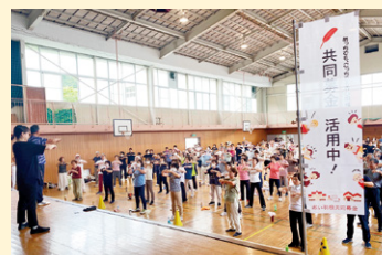
「ラジオ体操講習会」の様子 (ラジオ体操愛好会主催)