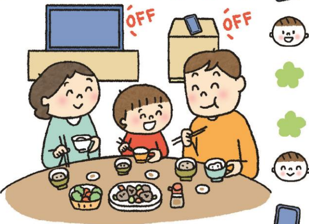
家族との食事時間を「楽しい」と感じることで、情緒の安定にもつながります。

家庭では、スマホもテレビもゲームも消して、食べる喜びを共有できるといいですね。「食べるって楽しい」「食事はうれしい時間」と経験した子どもは、生涯を通じて、人と食べる喜びをもち続けられます。