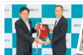
(株)ホンダテクノフォート(洒水学園へ)