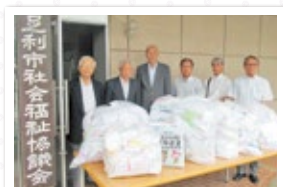
栃木県退職公務員連盟足利支部