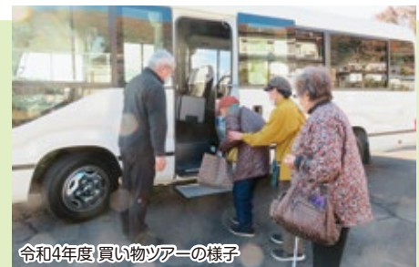
令和4年度 買い物ツアーの様子

・地区社協が行う年末年始ひとりぐらし高齢者等特別訪問活動、ふれあい・いきいきサロン活動 など