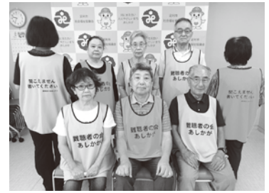
【活用事例】「難聴者の会」