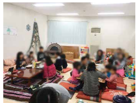
「足利流こども食堂」キッチンOZの様子