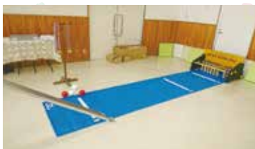
ビーンボウリング 《1セット》