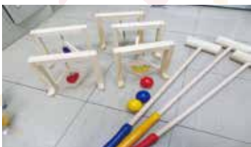
屋内用ゲートボール 《1セット》