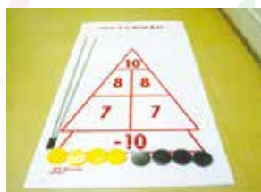
ディスクボード 《1セット》