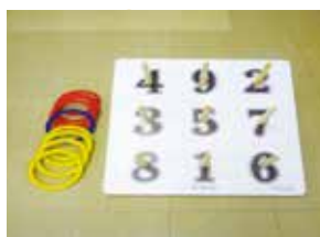
公式ワナゲ 《2セット》