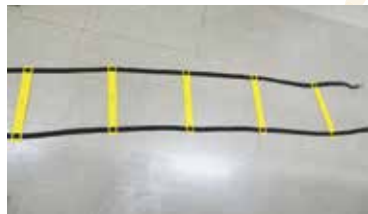
トレーニング用ラダー 《2セット》