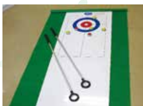
マインディスティック カーリング《1セット》