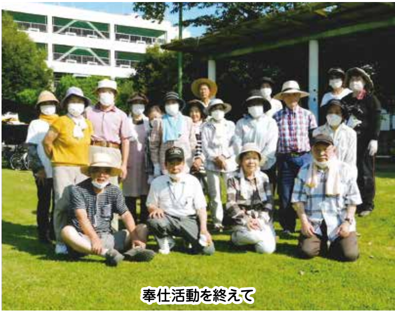
奉仕活動を終えて