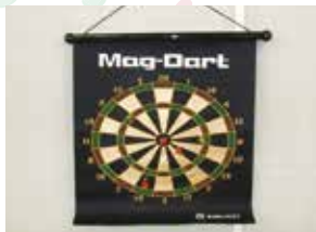
マグネットダーツ 《2箱(2セット入り)》