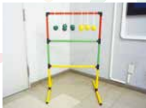
スウィングトスゲーム 《1セット》