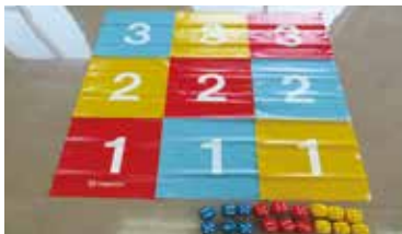
トリコロキューブ 《2セット》