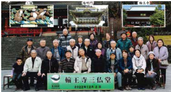
名草地区松寿会 湯西川温泉親睦旅行の皆さん

定刻に集合出発、旅に対して見るとさすが高齢者向けの旅程でゆるく、食事也大勢で食べるとうまい。宴会には飲みものが入ると30歳、40歳昔に戻るらしく、それなりに盛り上がり私ももとより皆様にも心の暖まる旅になったと思います。