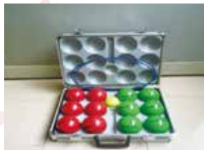
屋内用ソフト球 (ペタンク)《4セット》