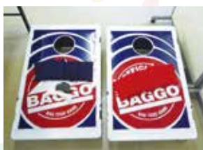
バグゴセット 《2セット》