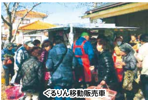
ぐるりん移動販売車