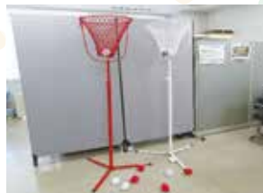
屋内用紅白玉入れ 《1セット》