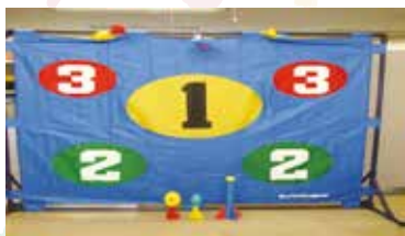
ボールゲームターゲット2 《1セット》