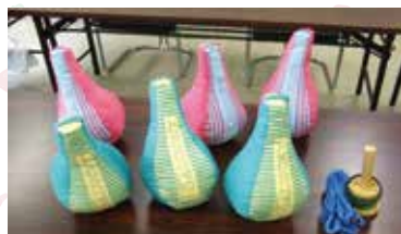
スポーツガラッキー 《1セット》