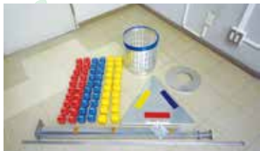
どっとボールセット 《1セット》