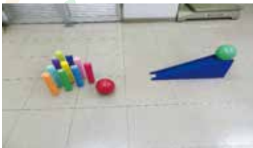
どこでもボウリング 《1セット》