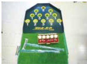
スカットボールセット 《1セット》