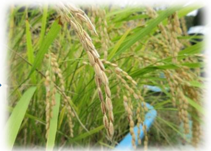
秋、稲穂が垂れ いよいよ稲刈りです！