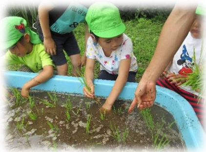
6月初旬、田植えをしました！