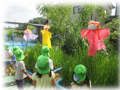
夏には稲がぐんぐん伸びて 「かかし」をつくりました！