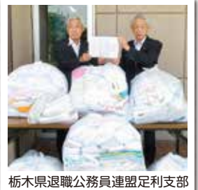
栃木県退職公務員連盟足利支部