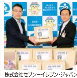
株式会社セブンイレブン・ジャパン