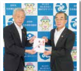
足利市農業協同組合