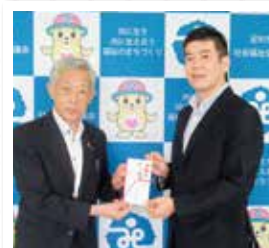
足利ガス株式会社