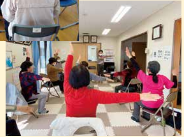
木曜会サロンの様子