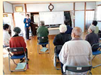
今福南町サロンの様子