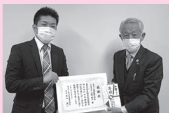
オウミ技研株式会社様から寄附をいただきました