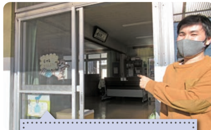
さわらびハイム足利 定期的に換気をして 密閉対策