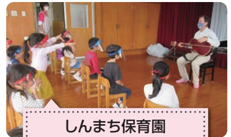
しんまち保育園 イスを離して ソーシャルディスタンス