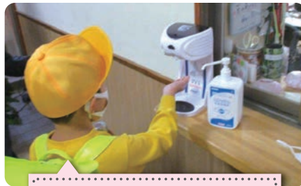
泗水学園 手指消毒でウイルス殺菌