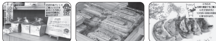
【パン専門店茶々】 かわり姫食パン 【うどん子】 生うどん 【グランシャリオ】 足利大麦餃子 「寄付つき商品」でのご協力を検討していただける場合は、当会までご連絡ください。 (地域福祉課0284-44-0322)

売上の一部を「赤い羽根共同募金」に寄付する取り組みです。足利市内では現在3店舗にご協力をいただき「寄付つき商品」として販売しております。