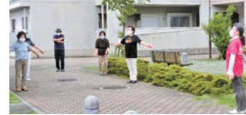
ラジオ体操の様子

毛野新町の高齢者交流の場を毎週1回設定し、ラジオ体操や講座などを実施しています。運動は外で実施し、感染拡大前に比べて時間を短くするなどの工夫をしています。