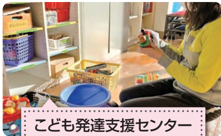
こども発達支援センター ぱれっとクラブあしかが おもちゃの消毒