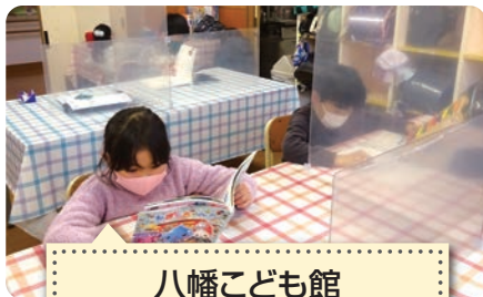
八幡こども館 にしこども館 透明ボードで飛沫対策

足利市社会福祉協議会では指定管理を含む14の施設を運営しています。 今回はその中から施設が取り組む新型コロナウイルス感染対策の一部を紹介します。