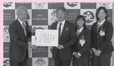
両毛ヤクルト販売株式会社様から寄附をいただきました