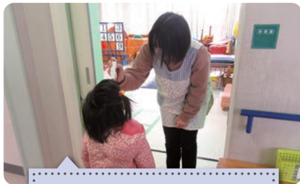
こども発達支援センター ぼけっとクラブあしかが 非接触体温計で検温中