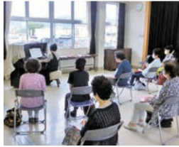
ピアノ伴奏に合わせてハミングをしている様子

「家から一歩出て何かやろう」をスローガンに月3回、毛野公民館で活動。音楽の日は歌わずにハミングをして飛沫が飛ばないように工夫をし、筋トレや手踊りはマスク着用やお互いの距離に注意して活動しています。