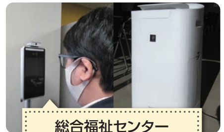
総合福祉センター 入口にサーマルカメラ・ 会議室に空気清浄機を設置