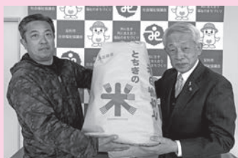
JA足利青壮年部様からお米の寄附をいただきました