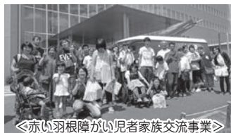
＜赤い羽根障がい児者家族交流事業＞

10/8・11/12に足利渡良瀬ゴルフ場主催の一人200円の寄附つき「赤い羽根チャリティコンペ」が開催されました。両日合わせて131名が参加され、募金箱と合わせて30,943円のご寄附をいただきました。台風19号による大きな被害にあわれた中、大変ありがとうございました。