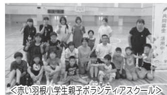
＜赤い羽根小学生親子ボランティアスクール＞

※ この募金のうち、6,319,349円が令和2年度に足利市社会福祉協議会へ配分され、足利市の地域福祉推進のために大切に活用させていただきます。 ※ 今年度ご協力いただきました法人・団体につきましては、社協ホームページに掲載します。