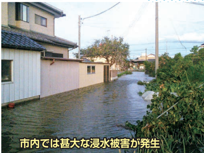
市内では甚大な浸水被害が発生

10月14日に「足利市災害ボランティアセンター」を設置し、239件のボランティア活動依頼に対して、延べ1,819名のボランティアの方々にご協力いただきました。12月27日以降は「足利市被災者支援ボランティアセンター」として引き続き被災者支援を継続しています。