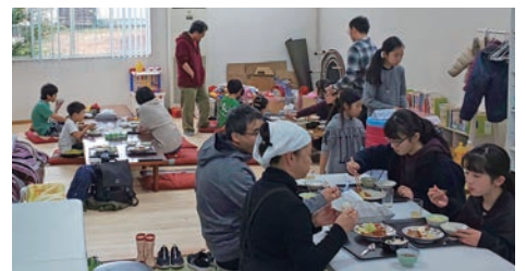
「足利流 こども食堂」魔女の台所 の様子