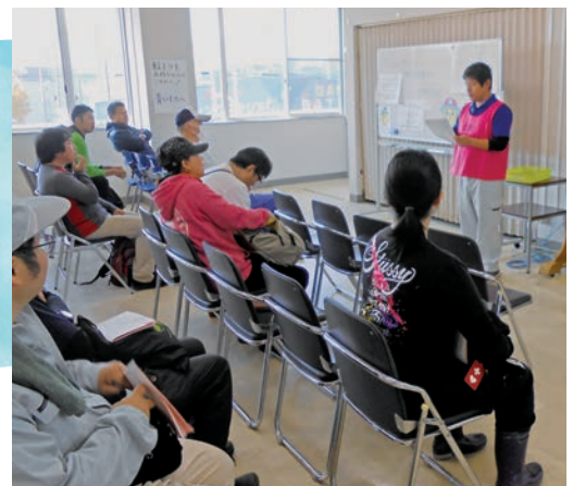
災害ボランティアセンターの様子

足利市社会福祉協議会では今後も災害ボランティアセンターの機能充実や地域での見守り活動への協力を進めていきます。