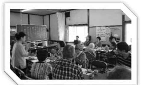
ふれあい・いきいきサロンの様子