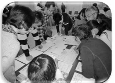
昨年度の災害ボランティア講座の様子