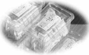
「赤い羽根応援うどん」

「赤い羽根募金応援うどん」としてイベント会場で販売し、その売上げから14,700円を赤い羽根募金へご寄付いただきました。