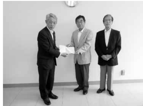
毎年、多数のタオルをいただいています。