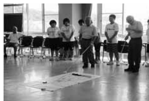
柳原地区の皆さん(左)と大橋地区の皆さん(右)