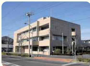
足利市社会福祉協議会